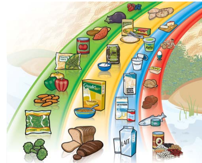
Légumes et fruits Produits céréaliers Lait et substituts Viandes et substituts

Un lunch santé comprend au moins un aliment de chacun des 4 groupes du Guide alimentaire canadien.